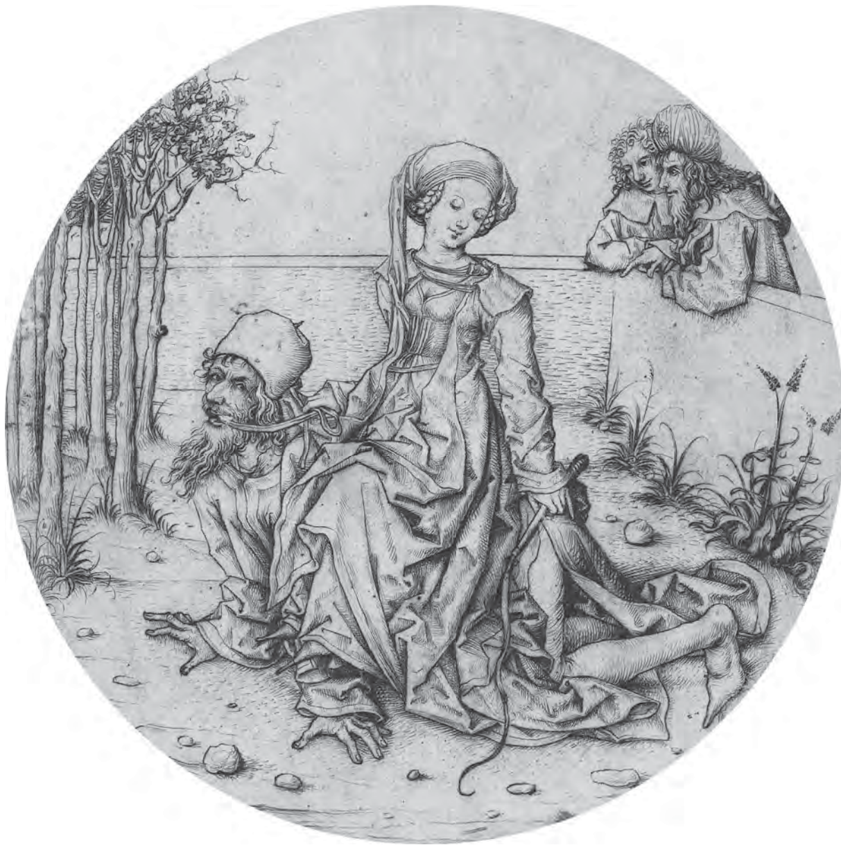
„Filida i Aristotel“, nepoznati/a autor/ica, Njemačka, 1485.