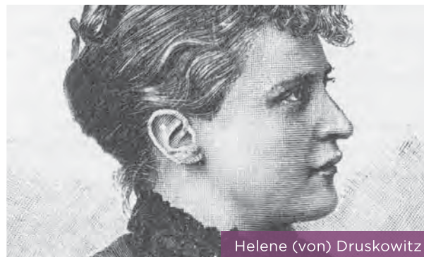
Helene (von) Druskowitz

Kanta, Arthura Schopenhauera i Herberta Spencera. Osim filozofskih knjiga ( Moderne Versuche eines Religionsersatzes, Wie ist Verantwortung und Zurechnung ohne Annahme der Willensfreiheit möglich?, Zur neuen