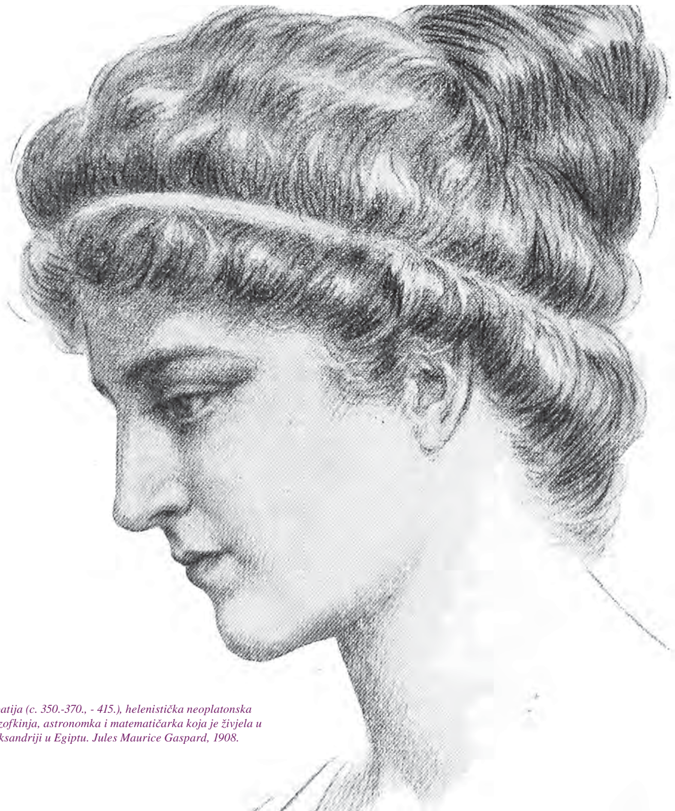
Hipatija (c. 350.-370., - 415.), helenistička neoplatonska filozofkinja, astronomka i matematičarka koja je živjela u Aleksandriji u Egiptu. Jules Maurice Gaspard, 1908.